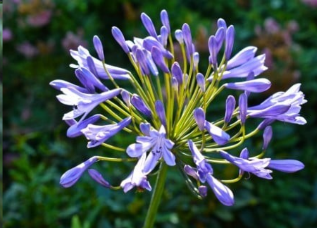
アガパンサス(紫君子蘭)